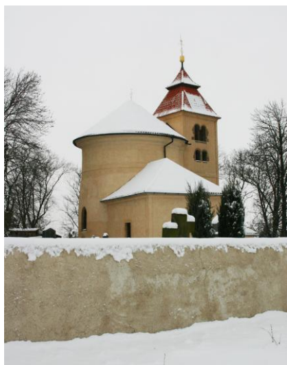
Rotunda sv. Petra a Pavla na Budči

Spuštění webu bylo plánováno na konec roku 2009, vzhledem ke snaze naplnit všechny položky stanoveného menu bylo spuštění oddáleno do poloviny roku 2010.