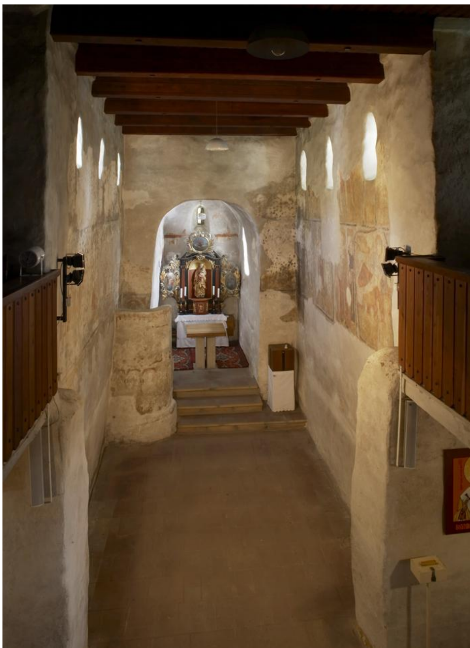
Interiér kostela sv. Juraja v Kostol'anech pod Tribečom, súčasný stav