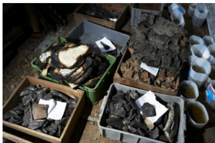
Fragmenty z depozitáře po požáru v Mikulčicích

Výtěžek veřejné sbírky měl být použit na obnovu mikulčického archeologického výzkumu, konkrétně na obnovu archivu a jeho digitalizaci, laboratoří a také na oživení terénního výzkumu.