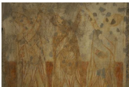
Detail nástěnných maleb v kostele sv. Juraja

Malý kostelík ve své nejstarší části uchovává vzácné nástěnné malby z počátku 11. století. Malby jsou však trvale vystavovány kolísavému vnitřnímu prostředí a dochází k jejich stírání, což může ve velmi krátké době znamenat jejich fyzický zánik. Významná je i o dvě století mladší přístavba k nejstarší části, stavbu významně degraduje necitlivá přístavba z poloviny 20. století.