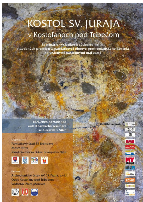
Plakát workshopu, nerealizovaný návrh