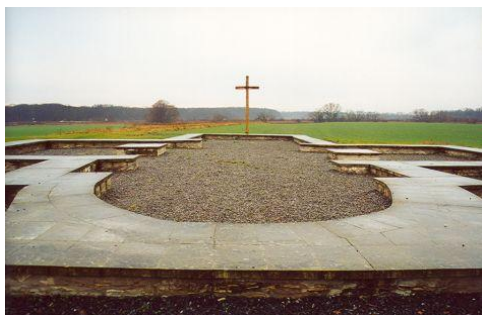
Libické hradiště, základy kostela