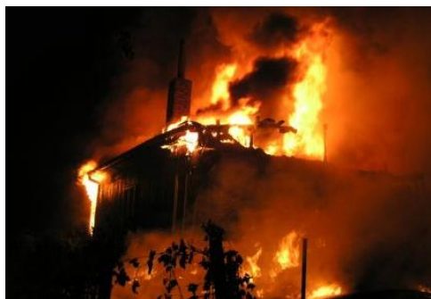
Fotografie z požáru depozitáře v Mikulčicích

Výtěžek veřejné sbírky bude použit na obnovu mikulčického archeologického výzkumu, konkrétně na obnovu archivu a jeho digitalizaci, laboratoří a také na oživení terénního výzkumu.