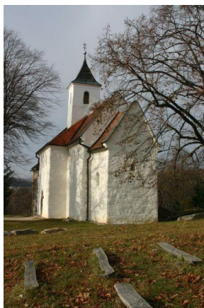
Kostel sv. Juraja v Kostolanech pod Tribečom

Malý kostelík ve své nejstarší části uchovává vzácné nástěnné malby z počátku 11. století. Malby jsou však trvale vystavovány kolísavému vnitřnímu prostředí a dochází k jejich stírání, což může ve velmi krátké době znamenat jejich fyzický zánik. Významná je i o dvě století mladší přístavba k nejstarší části, stavbu významně degraduje necitlivá přístavba z poloviny 20. století.